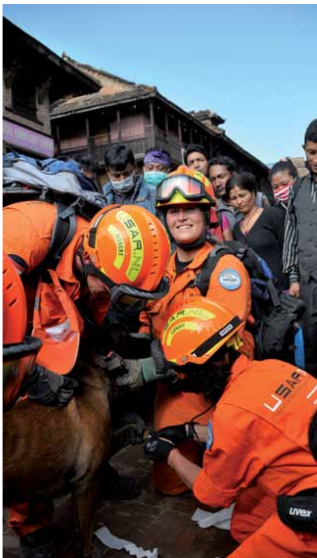
Ook reddingshonden kunnen gewond raken en moeten dan verzorgd worden