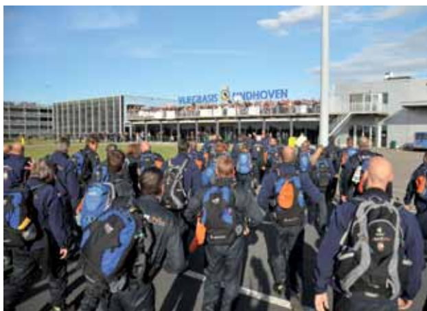
Weer naar huis...